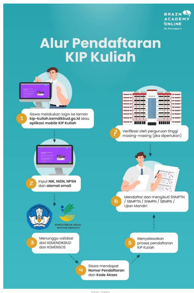
Gambar.2. Alur Pendaftaran KIP Kuliah

. Berikut alur Pendaftaran mahasiswa baru jalur KIP Kuliah :